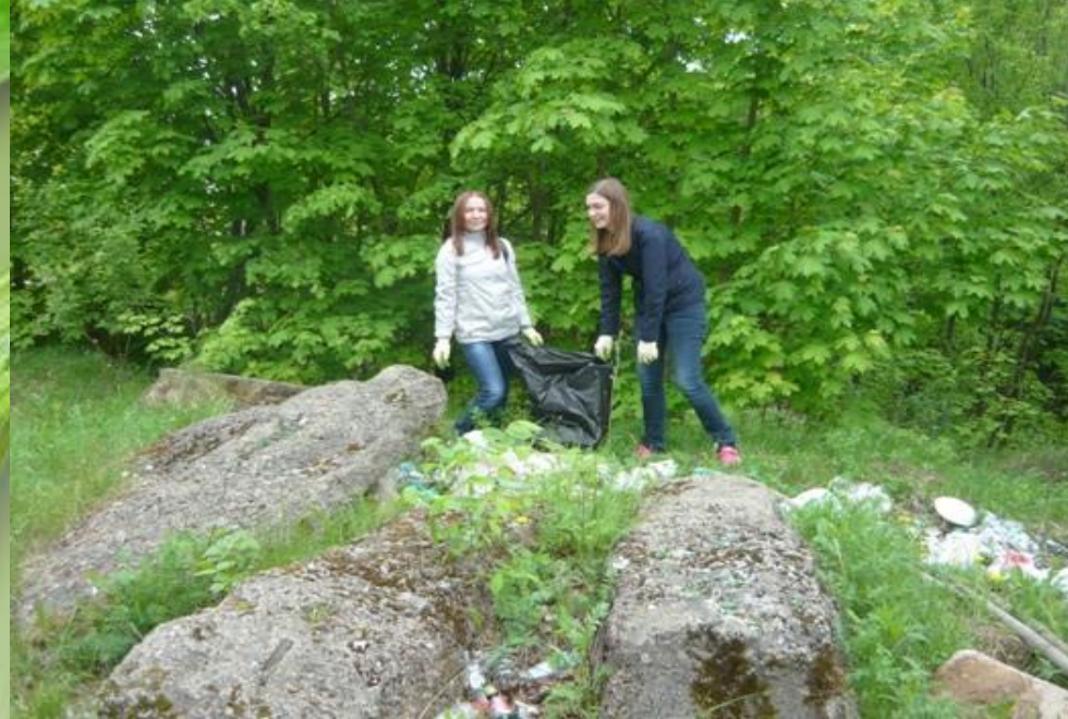
Субботник на территории памятника природы «Урочище Слуда»