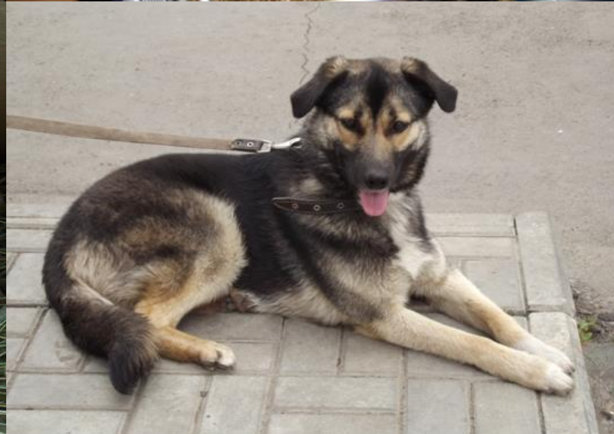
Живой уголок на очистных сооружениях ливнестоков