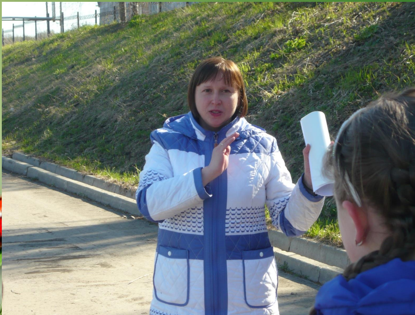
Экскурсия на очистные сооружения ливневых стоков