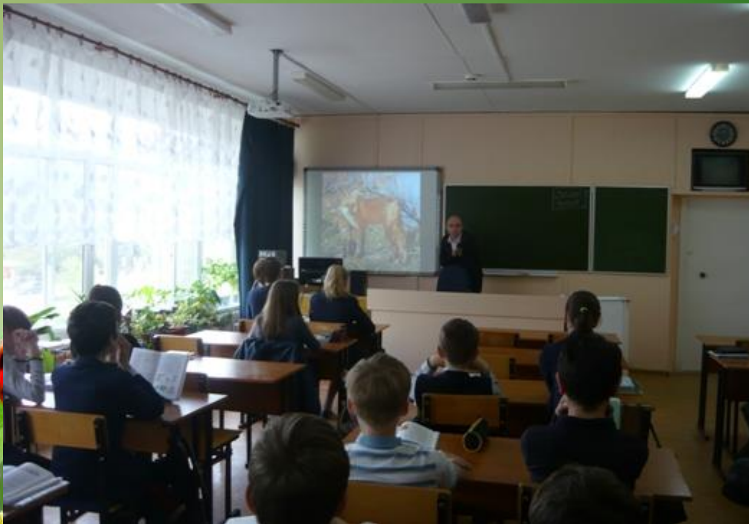
Урок «Щелковский хутор – памятник природы» в школе № 32