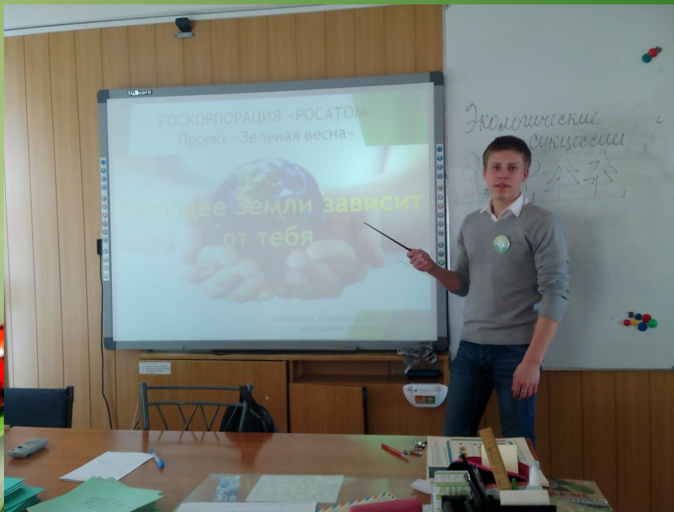
Урок в школе № 45 «Будущее Земли зависит от тебя»